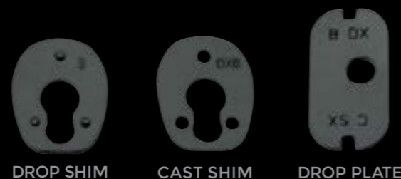
DROP SHIM CAST SHIM DROP PLATE

PIEGA 55 MM / DEVIAZIONE +6 MM CONFIGURAZIONE STANDARD DROP 55 MM / CAST +6 MM STANDARD CONFIGURATION