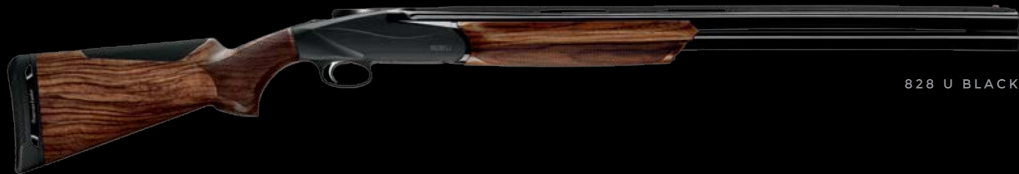
828 U BLACK